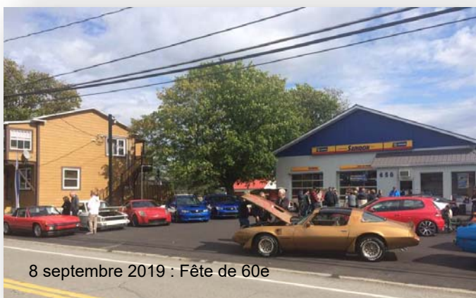
8 septembre 2019 : Fête de 60e